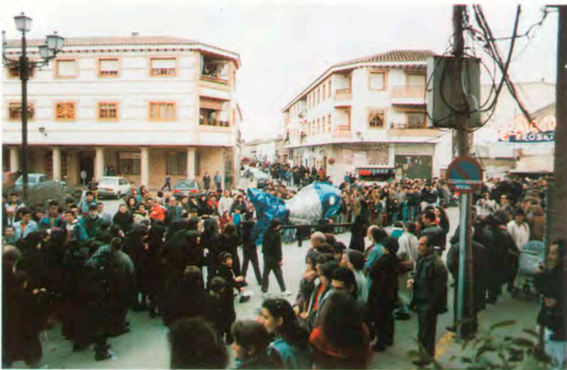
Entierro de la Sardina - CARNAVAL'92