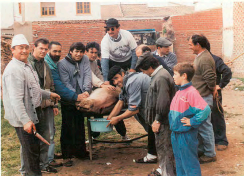
Peña "La Cabra"