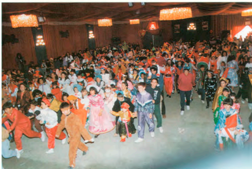
Carnaval Infantil 92