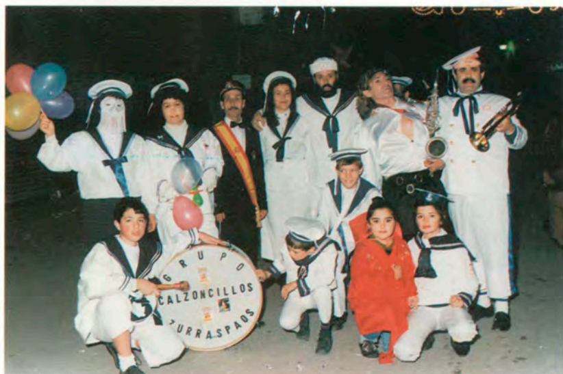
Peña "Calzoncillos Zurraspasos"