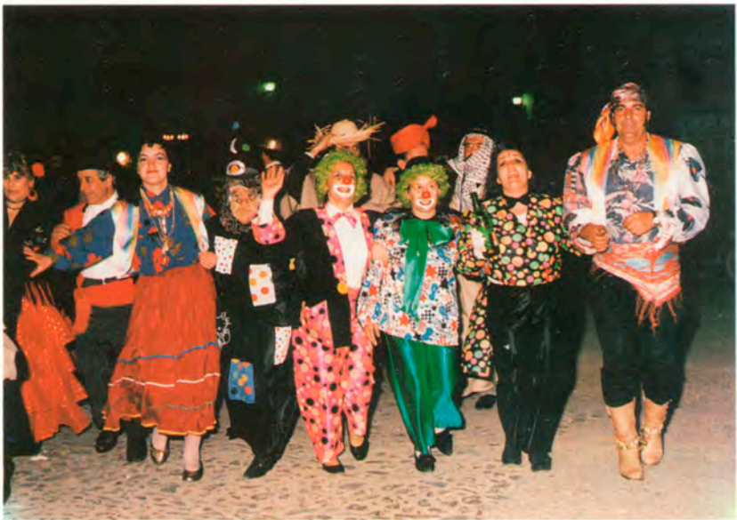
Peña "Los Segadores"