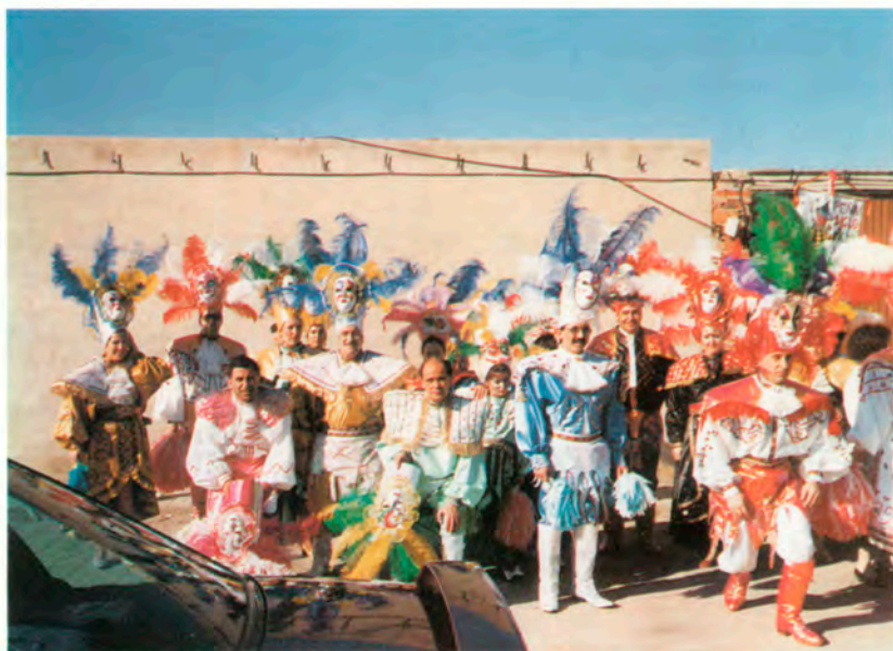
Peña "Siglo XXI"