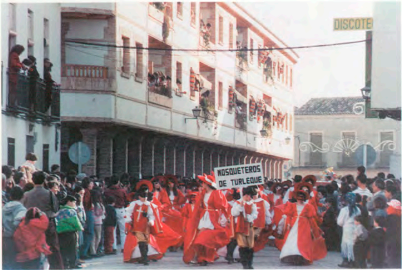
Participantes domingo de Piñata