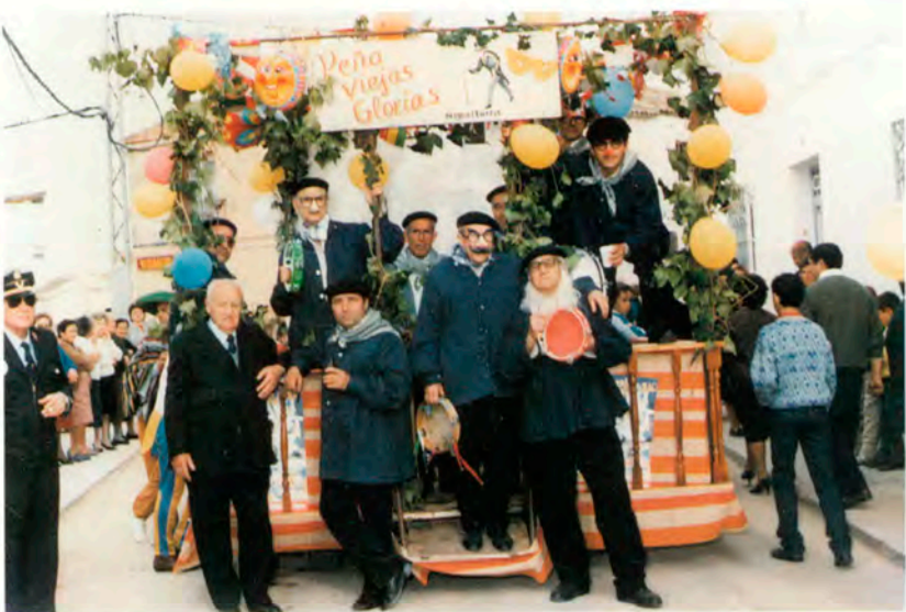
Peña "Viejas Glorias"

i NOTA: A la entrada a la Carpa , y durante todo el acto, jóvenes del A.D.V. Miguelturra solicitarán la colaboración de los asistentes mediante la venta de papeletas para el sorteo de un viaje para DOS PERSONAS, de 4 DIAS de duración (3 noches) a la ISLA DE TENERIFE, y que ha sido donado por VIAJES HALCON de Ciudad Real (oficinas en Ciudad Real, Puertollano y Valdepeñas.)