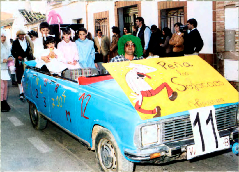
Peña Los Sofocaos.

Presentará el acto: Taller de Radio de la Universidad Popular .