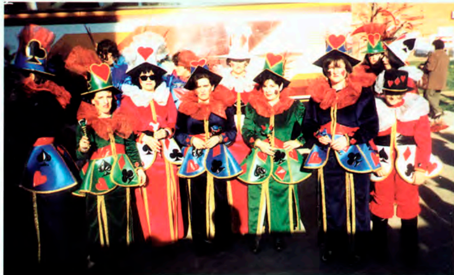
Peña La Cabra.

La Organización del Cortejo fúnebre, correrá a cargo de la Peña La Cabra .