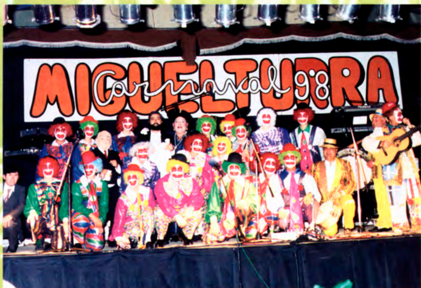
Peña El Jamón.