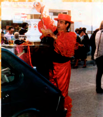
Peña Los Maltrataos

Con buen humor, la Peña El Bufón se encargará de hacer felices a los niños este día. La concentración, como cada año, se realizará en la Plaza de la Constitución y disfrazados de nuestros personajes favoritos, nos dirigiremos al Palacio del Carnaval en calle José Mora, para disfrutar de una macrofiesta que nos trae el Grupo Lía Lío Animación .