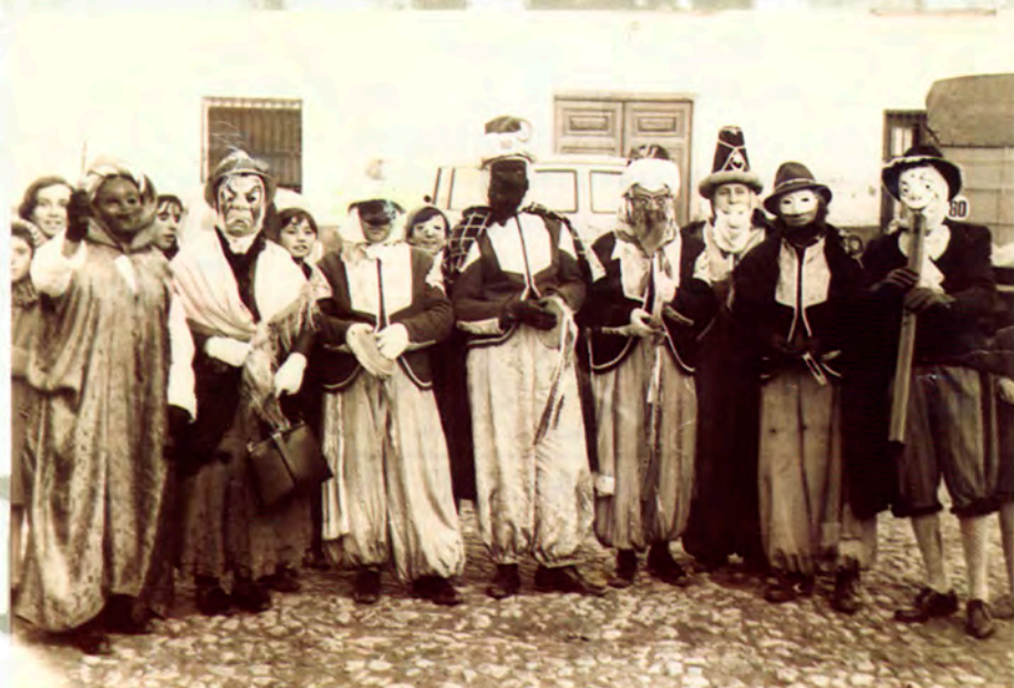
Peña Viejas Glorias.