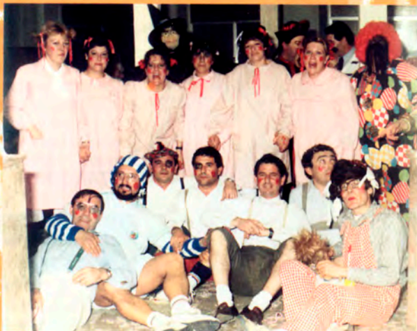
Peña "Siglo XXI".