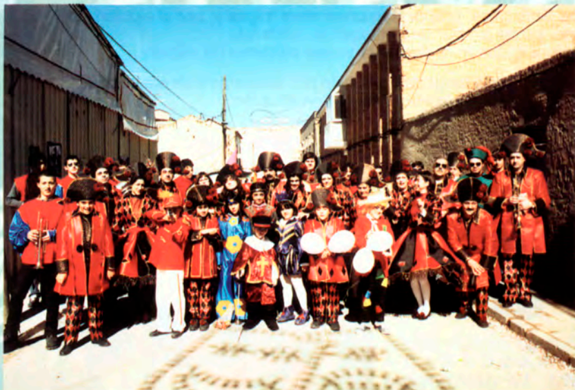
Peña El Bufón.