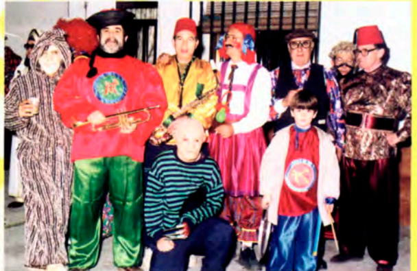
Peña "Calzoncillos Zurraspaos".

Este día es muy peculiar, muy propio de nuestro Carnaval. Las rosquillas, los barquillos, flores, borrachuelas y roscapiñas remojadas con limoná, serán el centro de atracción en este XVI Concurso de Fruta en Sartén.