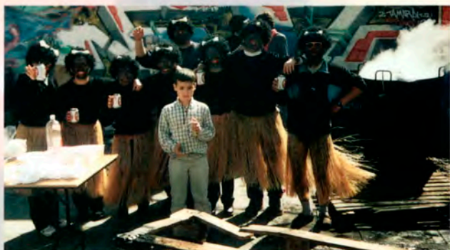
Peña "Barón Amarillo"