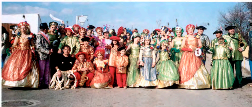
Peña “La Cabra”

La organización del cortejo fúnebre correrá a cargo de la Peña “La Cabra”.