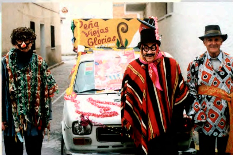
Peña "Viejas Glorias"

1ª. P o d r á n tomar parte todos los grupos que lo deseen, siempre que cuenten con un mínimo de 20 personas y sean de cualquiera de las localidades de la Región