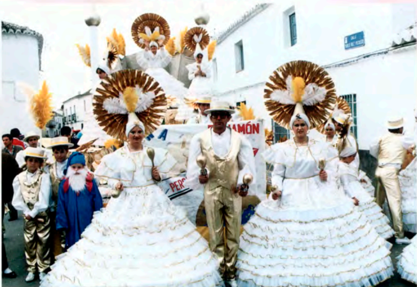
Peña "El Jamón"

A continuar con la juerga bailando en el Palacio del Carnaval, acompañados de las Orquestas: "Acapulco Show y Nueva Alaska".