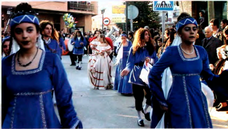
Peña "Los Maltrataos"

En el Palacio del Carnaval todos a bailar con la "Orquesta Mermelada".