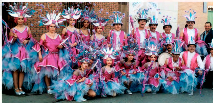
Peña "Los Segadores"

En el Palacio de Carnaval instalado en calle Portugal música Disco.