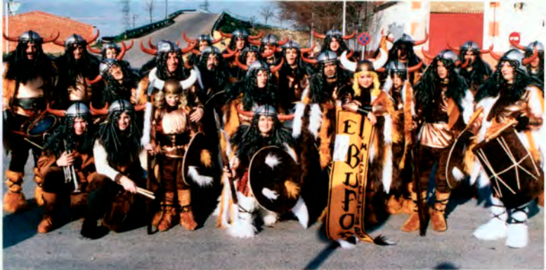
Peña "El Bufón"

Un año más la Peña "El Bufón" se encargará de que los más pequeños lo pasen fenomenal.